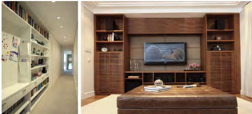
Arq. Paula Mattar – Circulação íntima, estante, apoio para agilizar o dia a dia dos moradores / Teresa Gouveia – Home. Duas torres laterais com uma adega em cada torre, as portas ripadas foram feitas para o respiro dos aparelhos. O móvel baixo central contém nichos sob medida para os aparelhos. No painel atrás do ar condicionado temos um telão.

Para atender da melhor maneira possível os profissionais, a Linea Mobili trabalha com tecnologia BLUM (sistema alemão de abertura e fechamento), cartela importada de pantone (mais de 500 combinações de cores), Cinex (vidro colorido com perfil de alumínio), iluminação LED e outros diferenciais que transformam, organizam e ampliam os ambientes.