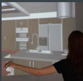
MAR 2013 | TOPO

Novos produtos Bortolini Com formas contundentes e funcionalidade evidente, o design da linha Triarii da Bortolini não passa despercebido. Esta linha simboliza o triário, o comandante, o mais preparado. Triarii era a terceira linha de ataque da Legião Romana, formada por oficiais mais experientes e fortes, encarregados de gerenciar e finalizar a batalha. A linha Triarii da Bortolini foi criada para os comandantes da era contemporânea, onde o desafio agora é comercial e também exige flexibilidade, criatividade e atitudes práticas. www.bortolini.com.br