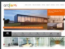
MAR 2013 | TOPO