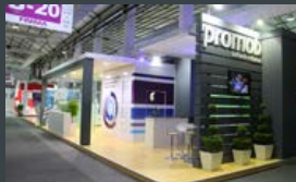
MAR 2013 | TOPO

Interatividade foi a marca da Promob na FIMMA 2013. Quem procurou a FIMMA Brasil 2013 em busca de novidades encontrou na Promob um retrato apurado das novas realidades tecnológicas. Além de ser uma das patrocinadoras do evento, a Promob marcou presença em dois espaços próprios, ambos equipados com a tecnologia Kinect, um sensor que capta o movimento do corpo e o reproduz no ambiente que está na tela, propondo uma nova experiência com as máquinas e no caso da Promob, com os projetos. A iniciativa foi inédita para o setor moveleiro e teve ampla repercussão, inclusive entre os veículos de comunicação que fizeram a cobertura da feira. Além do aspecto lúdico, o uso do Kinect teve um caráter investigativo. www.promob.com