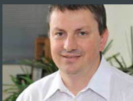
JAN 2013 | TOPO

FASA Fibra Ótica no Facebook Foi inaugurada, no início do ano, a Fan Page da FASA no Facebook, mais um recurso para visualizar as possibilidades de uso da fibra ótica como ferramenta de iluminação arquitetural e decorativa. Com conteúdo exclusivo para a rede social, quem curtir a página poderá estar atualizado com as principais novidades desta tecnologia e da empresa, bem como fotos inéditas, informações sobre cursos, notícias, sorteios, promoções e muito mais. Em poucas semanas no ar a Fan Page obteve um número expressivo de seguidores, que tem aumentado a cada dia. Para conhecer a Fan Page da FASA Fibra Ótica acesse www.facebook.com/fibraoptica