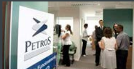
MAR 2013 | TOPO

Interatividade foi a marca da Promob na FIMMA 2013. Quem procurou a FIMMA Brasil 2013 em busca de novidades encontrou na Promob um retrato apurado das novas realidades tecnológicas. Além de ser uma das patrocinadoras do evento, a Promob marcou presença em dois espaços próprios, ambos equipados com a tecnologia Kinect, um sensor que capta o movimento do corpo e o reproduz no ambiente que está na tela, propondo uma nova experiência com as máquinas e no caso da Promob, com os projetos. A iniciativa foi inédita para o setor moveleiro e teve ampla repercussão, inclusive entre os veículos de comunicação que fizeram a cobertura da feira. Além do aspecto lúdico, o uso do Kinect teve um caráter investigativo. www.promob.com