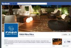
FEV 2013 | TOPO

AROTEM – Clube de empresas de produtos corporativos Lançado em 03/13, o portal AROTEM reúne um grupo seleto de empresas provedoras de soluções diversificadas para ambientes corporativos. O canal oferece em um único lugar uma estrutura completa para auxiliar escritórios de arquitetura e especificadores de projetos. A plataforma caracteriza-se como uma ferramenta facilitadora para criar relacionamentos. Participam do AROTEM as seguintes empresas: Design On (divisórias); Huffix (arquivos deslizantes); John Richard (aluguel de móveis); Larong (iluminação); Tecama (mobiliário), Tecno (assentos corporativos); Verona (carpetes e vinílicos) e Werden (pisos elevados). www.arotem.com.br