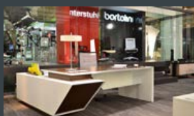
MAR 2013 | TOPO

Linea Mobili – Cozinha organizada A Linea Mobili oferece armários sob medida e de acordo com as necessidades do morador, todos os espaços são aproveitados, nichos, prateleiras, gavetas, organizam a residência e deixam o ambiente prático. Uma preocupação que a Linea Mobili tem ao projetar os móveis, é aliar o designer com o funcional, na cozinha mantimentos e louças que são usadas no dia a dia tem fácil acesso e os armários são projetados de acordo com o tamanho dos utensílios. Os móveis da Linea Mobili utilizam tecnologia Blum, sistema de acionamento austriaco que oferece segurança e praticidade, gavetas e portas se abrem com um simples toque e sem barulho. www.lineamobili.com.br